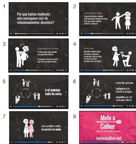
Figura 1 - roteiro do vídeo do ciclo do abuso

O vídeo tem o objetivo de oferecer uma teatralização da vida de uma mulher que sofre em um relacionamento abusivo.