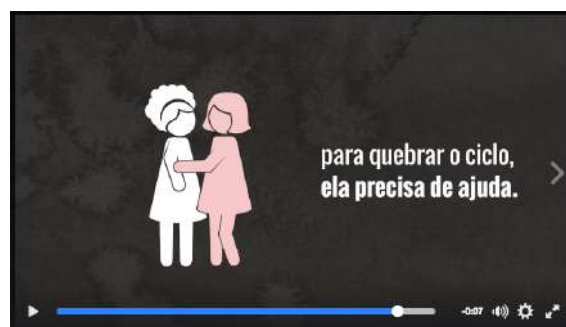
Figura 4 - cena 7 do vídeo do ciclo do abuso