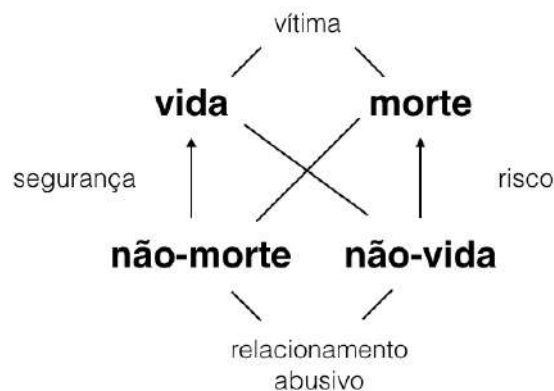
Figura 2 - esquema do nível fundamental

Adentrando no nível narrativo do percurso gerativo, no qual iremos analisar a narratividade do vídeo: “quando se tem um estado inicial, um transformação e um estado final” (FIORIN, 1989, p. 27-28). Nesta fase determina-se também os papéis do